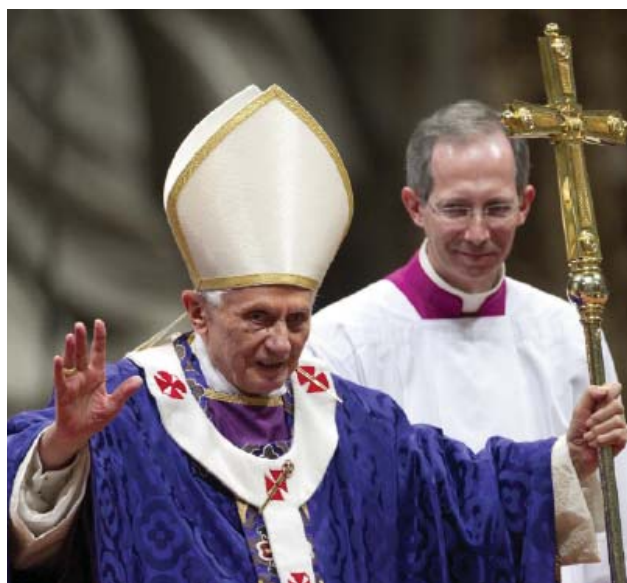
O Papa saúda os fiéis na missa de Quarta-feira de Cinzas, ontem

E chegamos ao seu último dia de Bento XVI como Papa. No dia 28 de Fevereiro, às 11h00 (hora de Roma), saúda todos os Cardeais que se deslocarem a Roma para o efeito e, pelas 17h00, parte de helicóptero para Castel Gandolfo, onde provavelmente ficará até o novo Papa ter sido eleito, evitando assim cruzar-se nos jardins do Vaticano com os cardeais que no mês de Março estarão reunidos em Conclave.